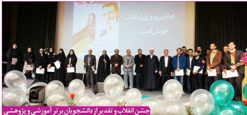
جشن انقلاب و تقدیر از دانشجویان برتر آموزشی و پژوهشی