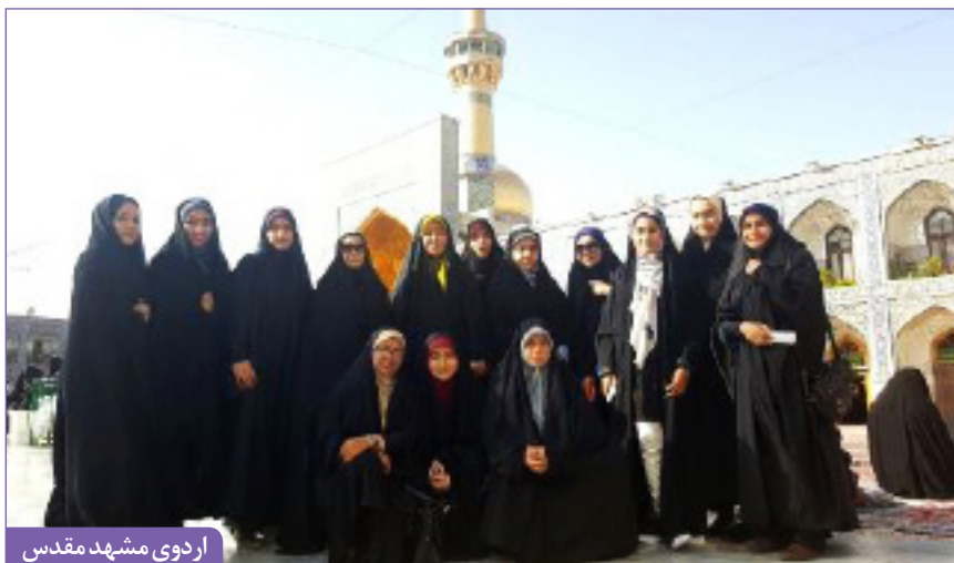
اردوی مشهد مقدس