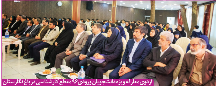
اردوی معارفه ویژه دانشجویان ورودی ۹۶ مقطع کارشناسی در باغ نگارستان