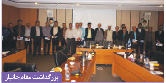
بزرگداشت مقام جانباز