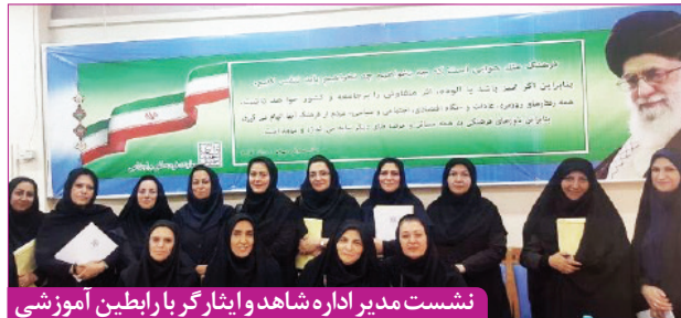
نشست مدیر اداره شاهد و ایثارگر با رابطین آموزشی