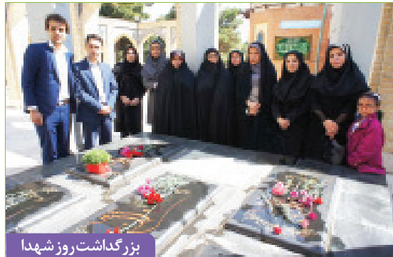
بزرگداشت روز شهدا