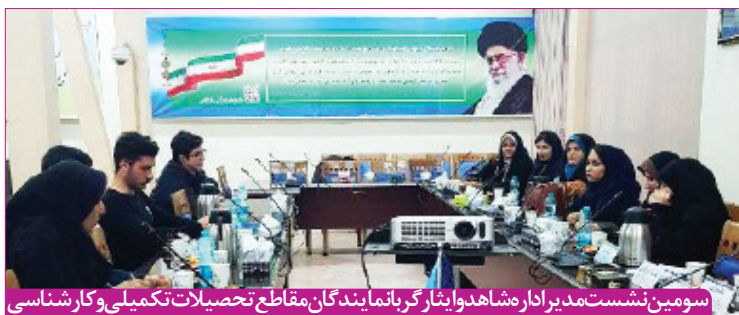
سومین نشست مدیر اداره شاهد و ایثارگر با نمایندگان مقاطع تحصیلات تکمیلی و کارشناسی