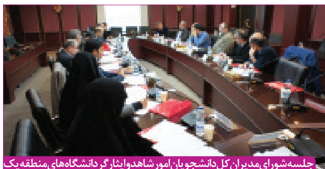
جلسه شورای مدیران کل دانشجویان امور شاهد و ایثارگر دانشگاه های منطقه یک