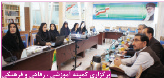
برگزاری کمیته آموزشی ، رفاهی و فرهنگی