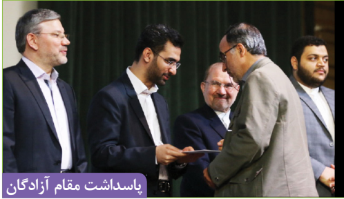
پاسداشت مقام آزادگان