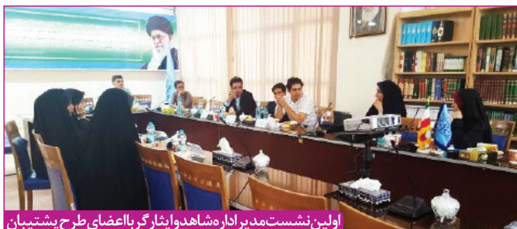
اولین نشست مدیر اداره شاهد و ایثارگر با اعضای طرح پشتیبان