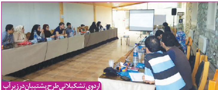
اردوی تشکیلاتی طرح پشتیبان در زیر آب