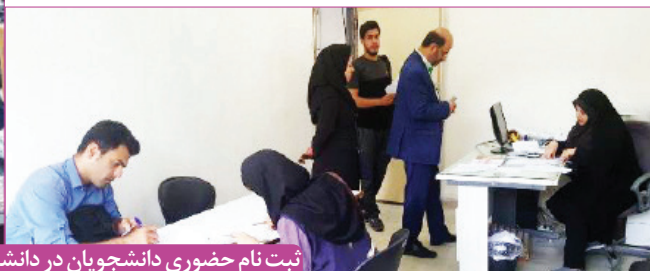
ثبت نام حضوری دانشجویان در دانشگاه برای دانشجویان شاهد و ایثارگر