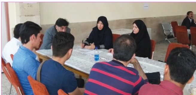
دانشکده مهندسی و علوم کامپیوتر