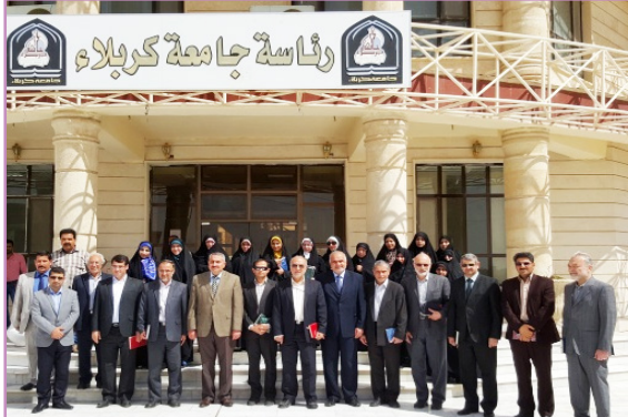
بازدید از دانشگاه کربلا