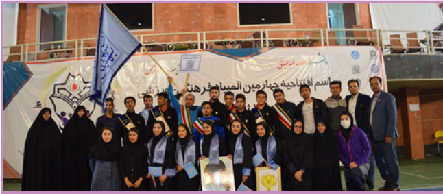
افتتاحیه چهارمین المپیاد ورزشی دانشجویان شاهد و ایثارگر اسفند ماه - دانشگاه علامه طباطبائی