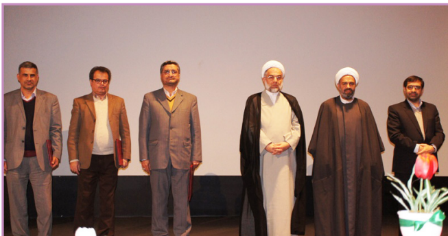
جشن انقلاب - تقدیر از اساتید شاهدو ایثارگر