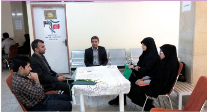
دانشکده علوم زمین