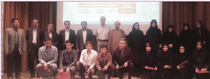
تقدیر از دانشجویان شاهد و ایثارگر برتر کنکور سراسری