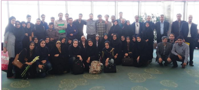
بازدید از برج میلاد