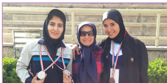
دو میدانی - مقام دوم و سوم انفرادی