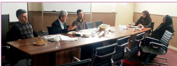
پردیس فنی و مهندسی شهید عباسپور