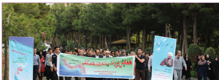
همایش پیاده روی به مناسبت هفته بسیج و گرامیداشت سالگرد شهید شهرپاری