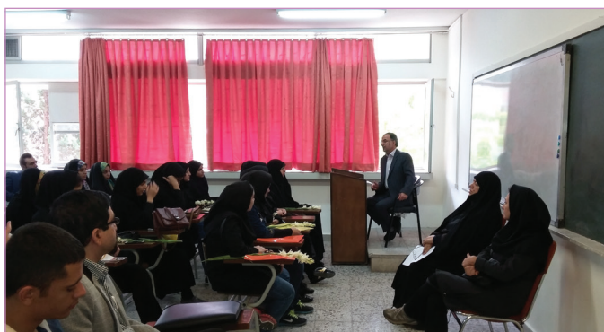
دانشکده مدیریت و حسابداری