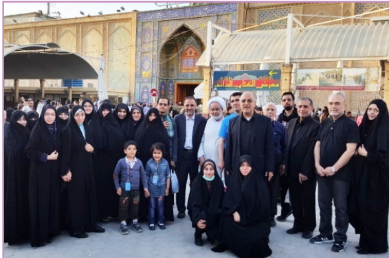
نجف - بارگاه حضرت علی علیه السلام