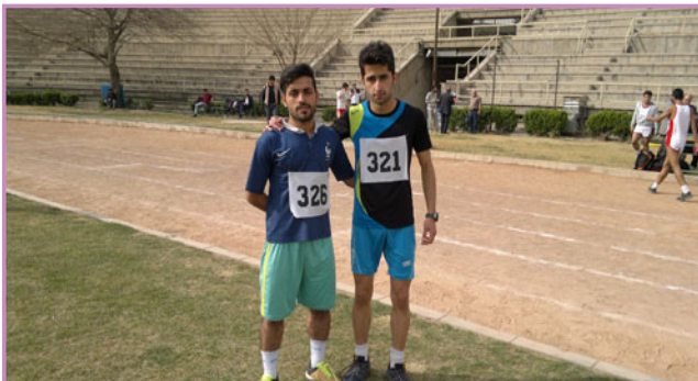
دومیدانی - مقام اول و دوم انفرادی