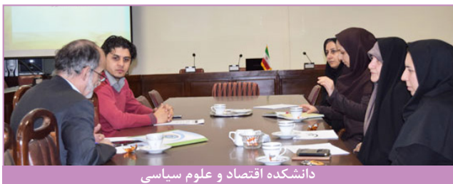
دانشکده اقتصاد و علوم سیاسی

نشست مشترک مدیریت امور شاهد و ایثارگر و اساتید مشاور دانشجویان شاهد و ایثارگر به تفکیک دانشکده ها