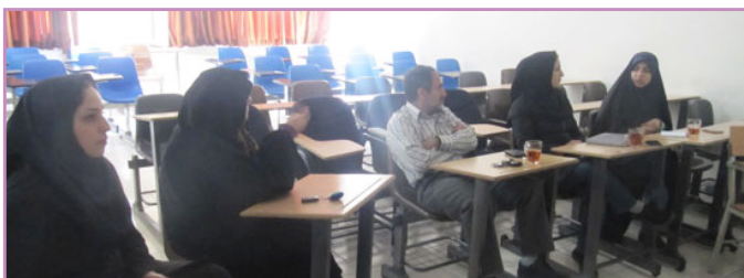
دانشکده علوم زیستی