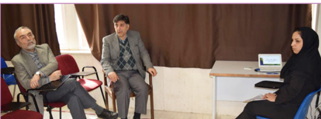
دانشکده مهندسی برق (پردیس مرکزی) و مهندسی علوم و کامپیوتر