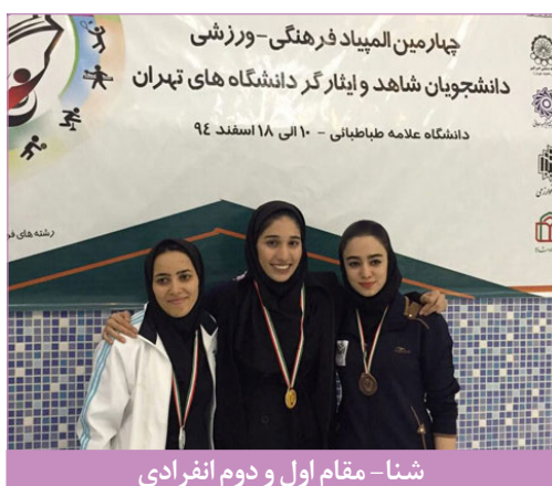
شنا - مقام اول و دوم انفرادی