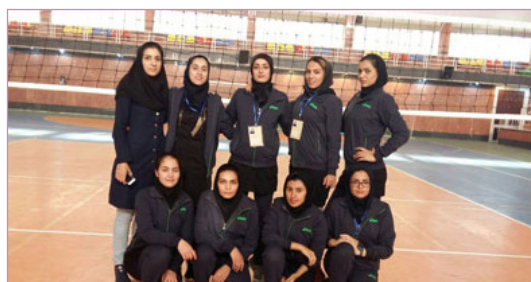
والیبال - مقام اول تیمی