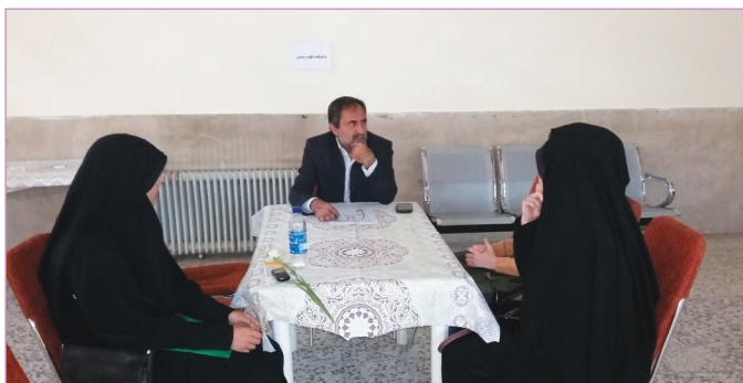
دانشکده علوم زیستی