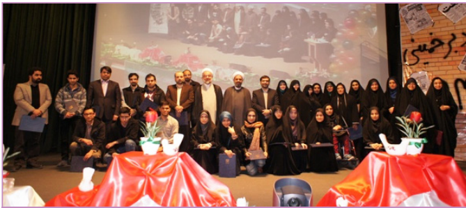
جشن انقلاب - تقدیر از دانشجویان برگزیده شاهدو ایثارگر