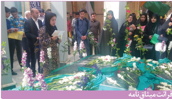
قرائت میثاق نامه