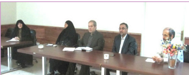
دانشکده مدیریت و حسابداری