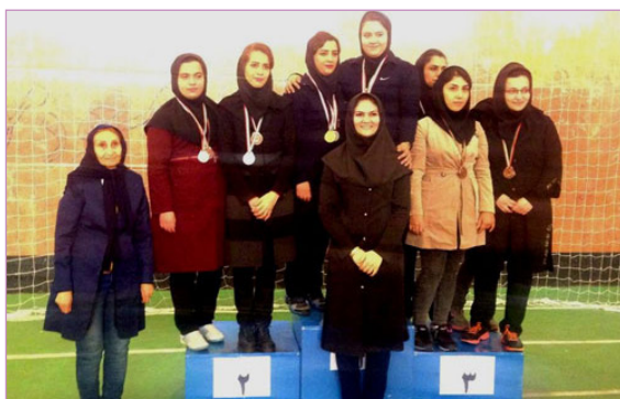
تنیس روی میز - مقام دوم تیمی و سوم انفرادی