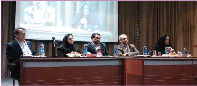
نشست با والدین و پاسخگویی به دغدغه های ورود فرزندان به دانشگاه