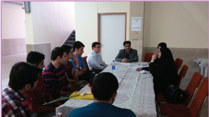
دانشکده مهندسی برق (پردیس مرکزی)