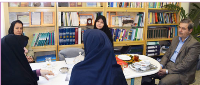
دانشکده ادبیات و علوم انسانی