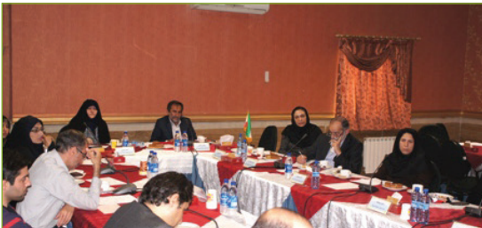
نشست مشترک اساتید مشاور با دانشجویان مقاطع تحصیلات تکمیلی