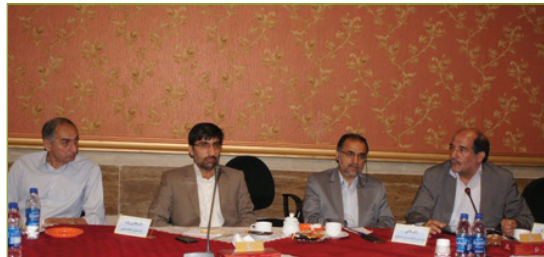
نشست هم اندیشی با موضوع "آسیب شناسی فعالیت های اساتید مشاور دانشجویان شاهد و ایثارگر"