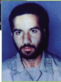
شهید مسعود شیخ