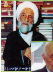
علامه محمد تقی شیخ شوشتری